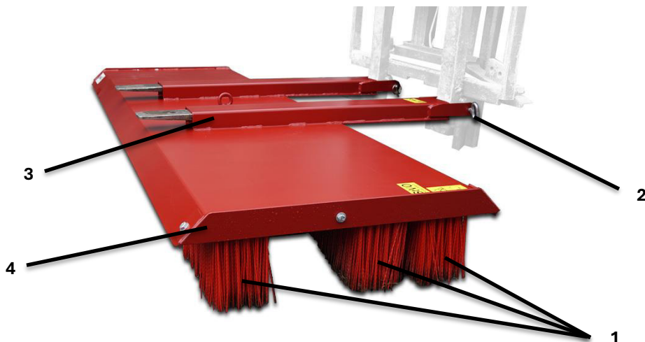
Abb. 1 Blockbesen proLine